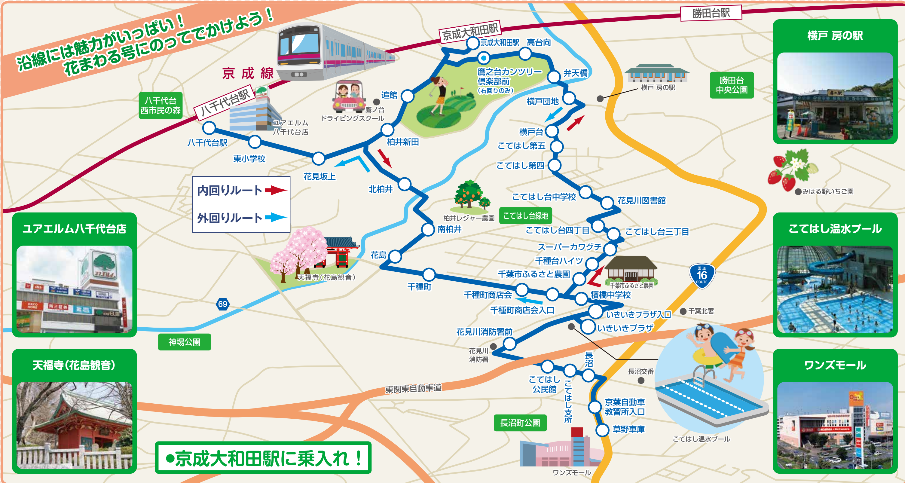
ユアエルム八千代台店