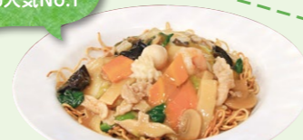
五目あんかけ 焼きそば 850円