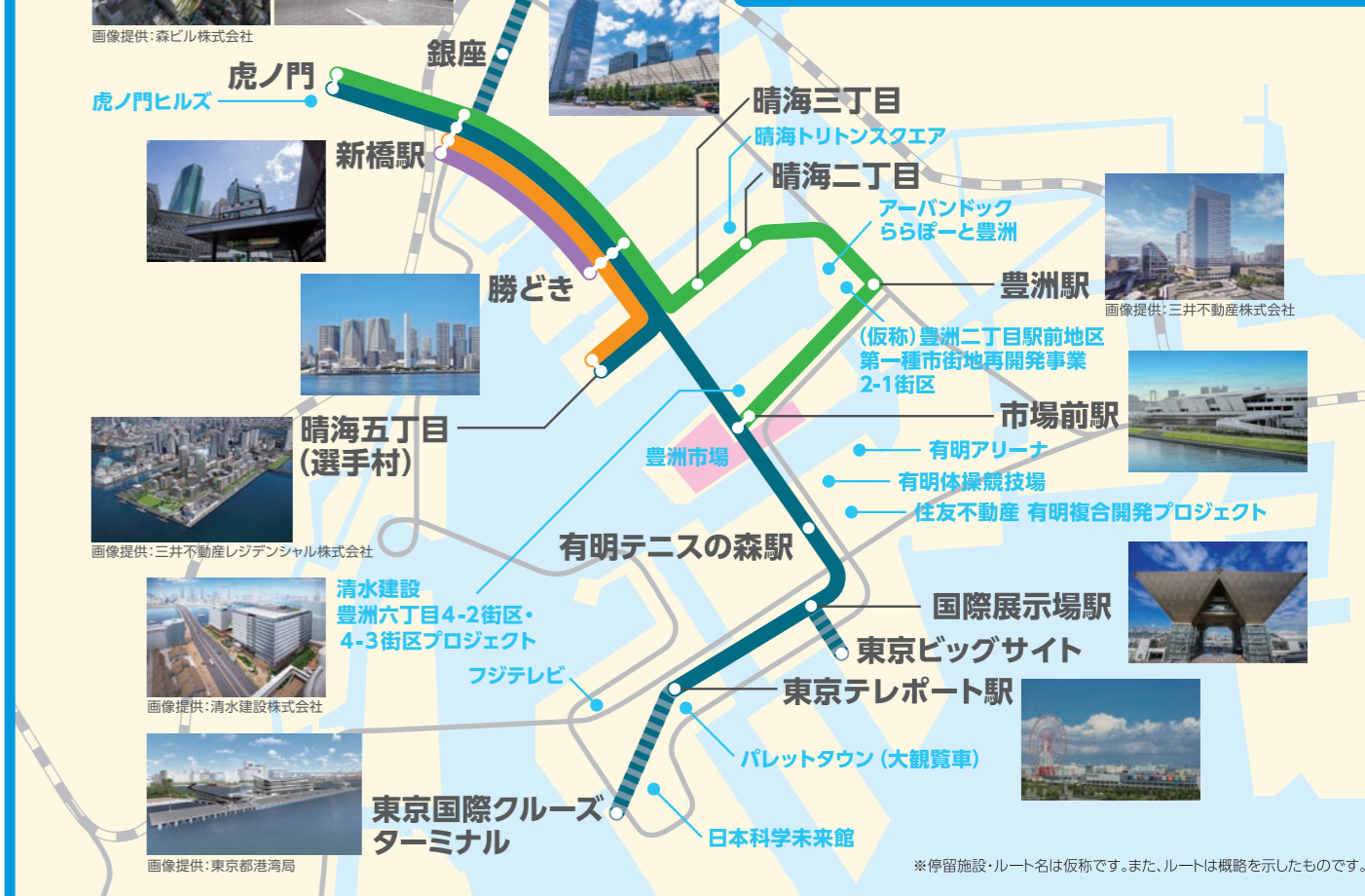
● 一次運行ルート ● 幹線ルート ● 晴海・豊洲ルート ● 勝どきルート ● 選手村ルート ● 検討路線

2022年度以降 環状第2号線 本線トンネル開通(2022年度)後、選手村まちびらき後