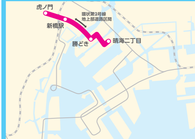
東京2020大会期間中の運行内容は、関係機関と調整中。

2020年度 環状第2号線 地上部道路開通(2019年度末)後、東京2020大会前・期間中