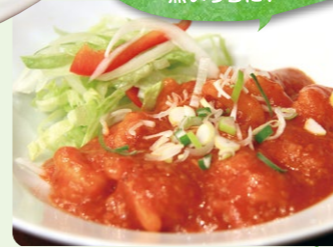
海老チリソース炒め 980円