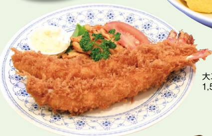
大エビフライ(2本) 1,580円