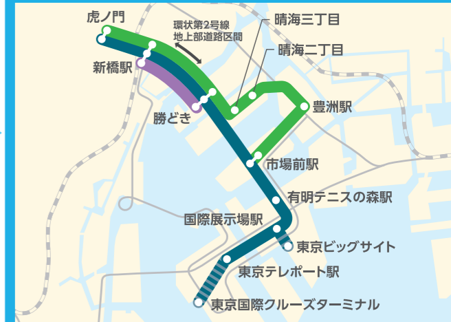
晴海二丁目～市場前駅は、市場前駅付近に整備される交通広場の完成(2020年度内予定)の後に延伸の予定。