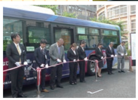
テープカットの様子(一番左:上田営業部長)