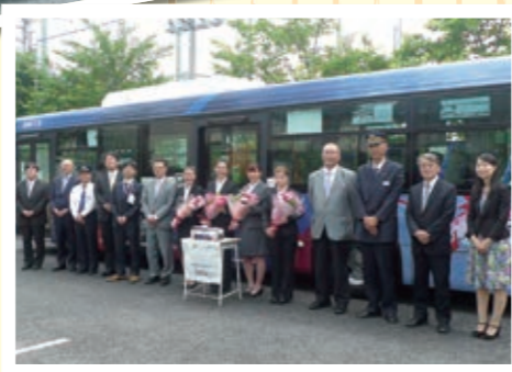
花束贈呈後のフォトセッションの様子