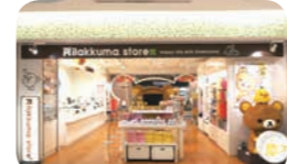
©2017 SAN-X CO.,LTD. ALL RIGHTS RESERVED.