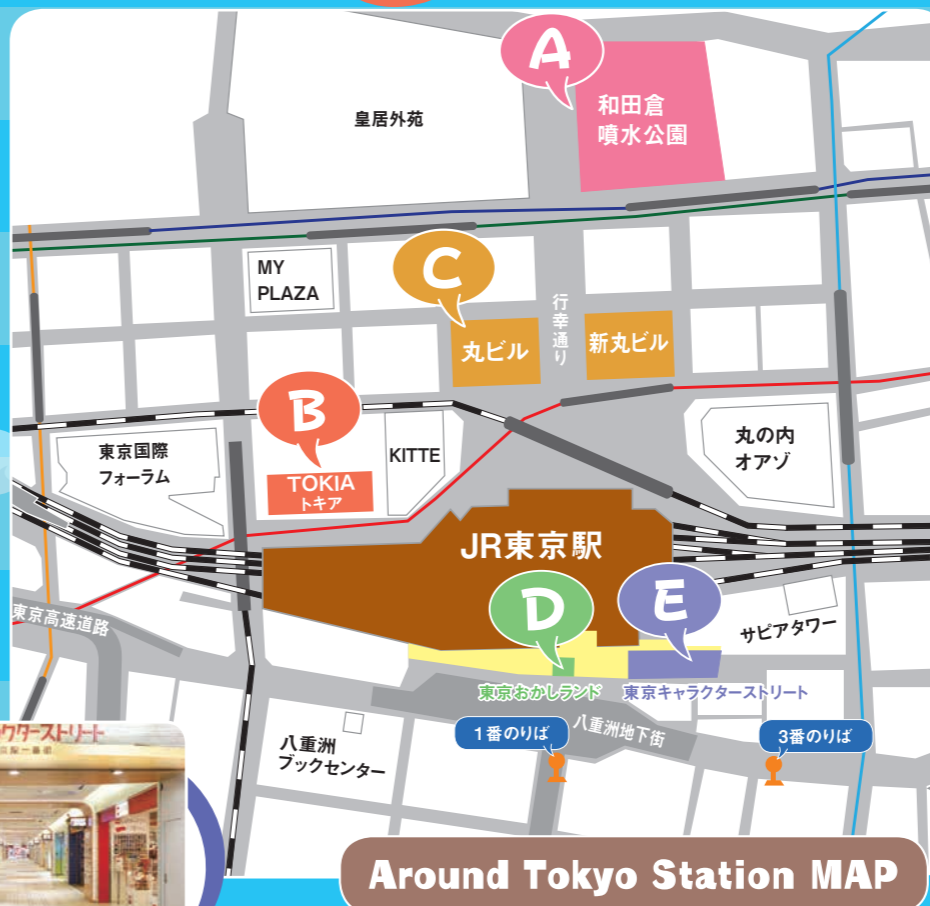
Around Tokyo Station MAP