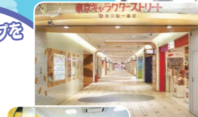
©2017 Pokémon. ©1995-2017 Nintendo/Creatures Inc./GAME FREAK inc.

住所 東京駅八重洲北口地下1階 (東京駅一番街 地下1階北通り) 営業 10:00~20:30 電話 03-3210-0077