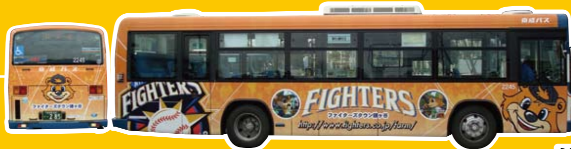
ららぽーと (船橋競馬場駅～ららぽーと)