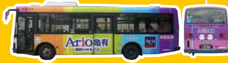
アリオ亀有 (青砥駅～立石駅～アリオ亀有)