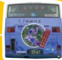
葛飾菖蒲まつり (金町駅周辺地区)

ラッピングバス お問い合わせ・お申し込み 京成バス(株)営業部乗合営業課 03-3621-2419 (株)京成エージェンシー媒体部 03-5614-1155