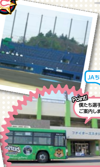
ファイターズタウン線の車内では、案内放送の一部をファイターズの選手達が担当。特にファイターズタウン鎌ヶ谷到着前は、収録時のおもしろNGシーンが流れます。大爆笑間違いなし!