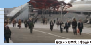
幕張メッセ中央下車徒歩1分

アジア最大級の規模を誇る、コンベンション施設“幕張メッセ” 家具のバザールや音楽祭など、今季もビッグイベントが目白押し。