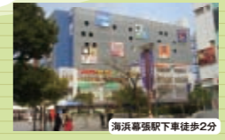
海浜幕張駅下車徒歩2分 食と遊を満喫できる商業施設“スク海浜幕張” 学生から中高年まで、幅広い世代に人気。