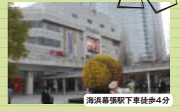
海浜幕張駅下車徒歩4分 多数のショップとレストランが集結する“プレナ幕張” 約60ものお店が入った幕張エリアを代表する商業施設。

免許センター往復割引乗車券を発売中! 幕張本郷駅→免許センター…320円(片道運賃170円区間) 海浜幕張駅→免許センター…300円(片道運賃160円区間)