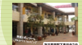
海浜幕張駅下車徒歩2分 人気のアパレルショップが建ち並ぶ“三井アウトレットパーク幕張” 人気のセレクトショップやスポーツショップが勢揃い。旬なアイテムをリーズナブルにゲットできます。