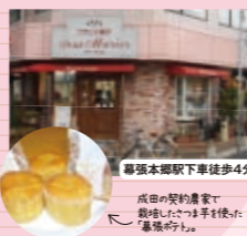
幕張本郷駅下車徒歩4分

〒千葉県花見川区幕張本郷6丁目25-20 ☎043-212-8801 10:00~22:00(日曜日・祝日10:00~20:30) 定月曜日(祝日の場合は翌日) http://www.makuhari-marier.com