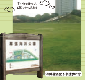
海浜幕張駅下車徒歩2分 心と体を癒してくれる“幕張海浜公園” 約67.9haの緑豊かなオアシススポット。