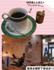
幕張本郷駅下車徒歩1分

〒千葉県花見川区幕張本郷1-3-5大岩ビル2F ☎043-276-5856 平日 8:30~21:00(L.O. 20:30)、土 8:30~18:30(L.O. 18:00)、日 10:00~18:30(L.O. 18:00) 年中無休(年末年始は除く)